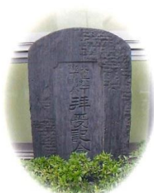
天皇陛下御下賜金拝受記念