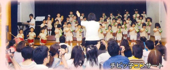
チビッ子コンサート